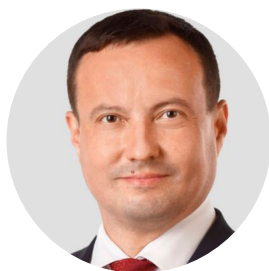
БИКЕЕВ ИГОРЬ ИЗМАИЛОВИЧ

кандидат социологических наук, министр цифрового развития государственного управления, информационных технологий и связи Республики Татарстан